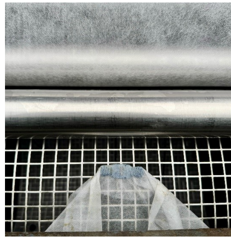
Das neue Vlies um die Trommel führen