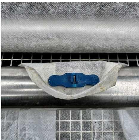
Den Rol-X Clip in Position wieder entfernen