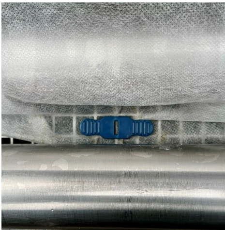
Den Rol-X Clip auf dem Gitter befestigen**

Mit zwei zusätzlichen Rol-X Clips ist es möglich, eine neue Rolle Filtervlies einzusetzen ohne das der Filtervorgang unterbrochen werden muss. Hierzu wird mit drei Clips das neue und das alte Filtervlies gemeinsam auf der Gittertrommel verbunden und mit dem normalen Filtervorgang um die Gittertrommel geführt. Zurück in der Ausgangsposition werden die Clips wieder entfernt, das alte Vlies entsorgt und das neue Vlies mit der Wickelhülse verbunden.